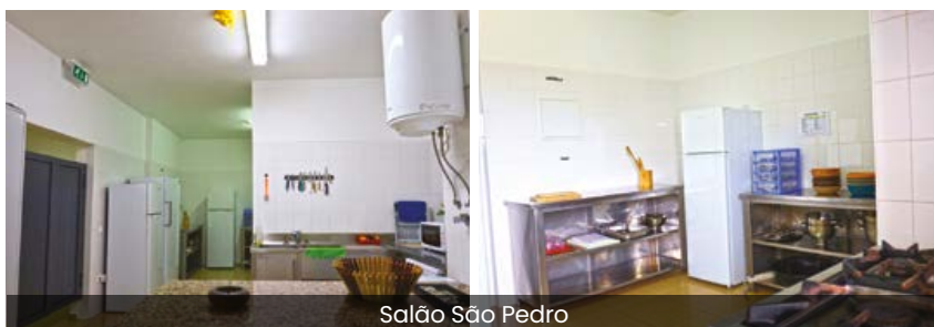
Salão São Pedro