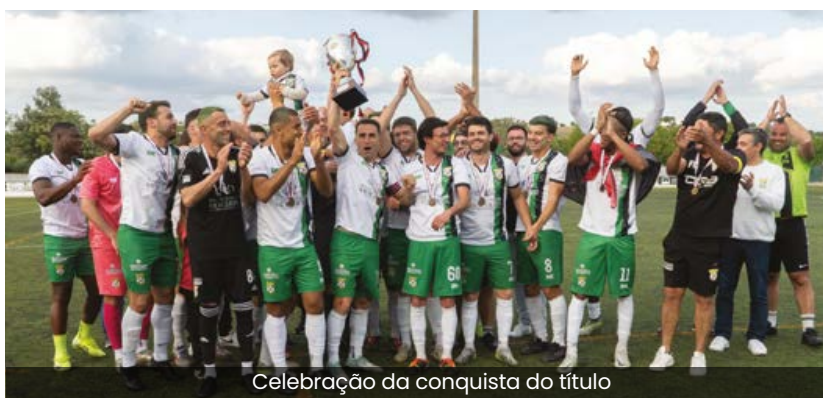
Celebração da conquista do título

Por estes feitos, mas também pelo trabalho que desenvolve todos os dias em prol do desporto e da comunidade, o "Vasco" está de parabéns! A Junta de Freguesia de Vidigueira parabeniza os atletas, técnicos, dirigentes e colaboradores do clube.