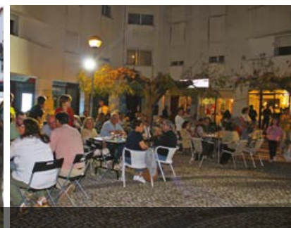
Atividades da Noite Liberdade