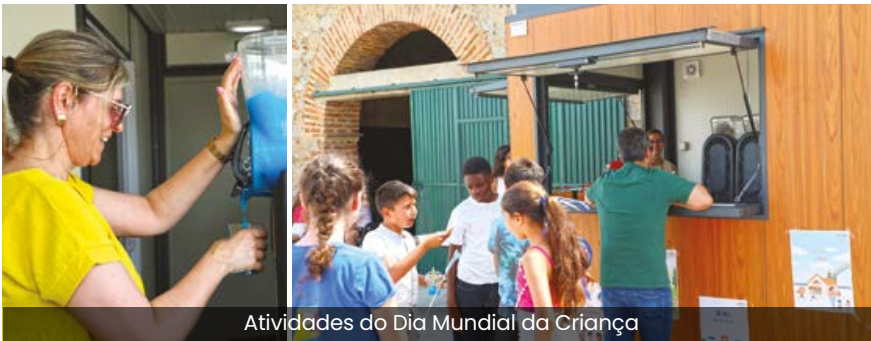
Atividades do Dia Mundial da Criança

tas que encantaram os pequenos. A iniciativa foi organizada em parceria com a Câmara Municipal, e à Junta de Freguesia de Vidigueira coube o papel de recarregar as energias da criançada, oferecendo um lanche delicioso e refrescantes granizados ao longo do dia.