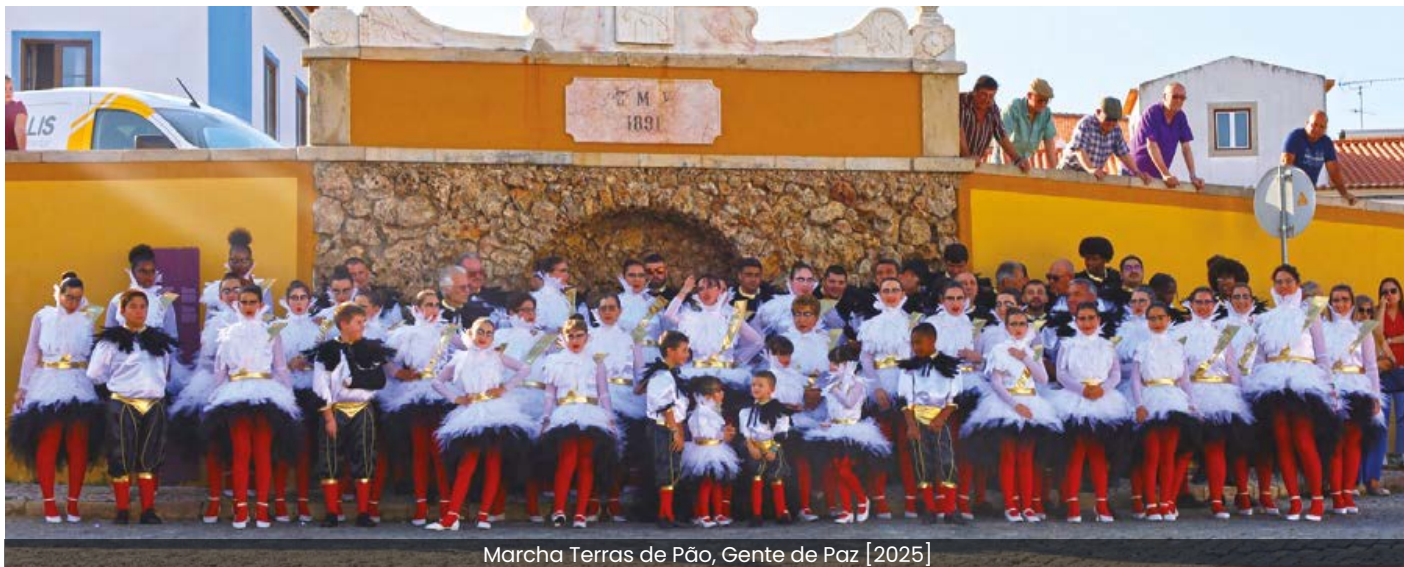
Marcha Terras de Pão, Gente de Paz [2025]

No dia 7 de junho, a Junta de Freguesia organizou a apresentação das Marchas Populares da freguesia, dando assim início à temporada de marchas populares na Vila de Vidigueira.