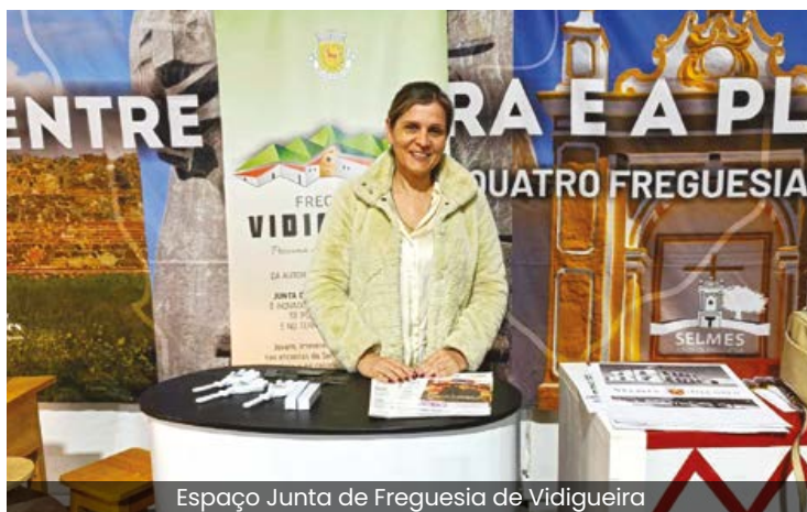
Espaço Junta de Freguesia de Vidigueira

Este festival, promovido pela Junta de Freguesia de Selmes, tem como objetivo valorizar a gastronomia associada ao recurso caça e a cultura local. A Junta de Freguesia de Vidigueira parabenizou a organização pela iniciativa e pelo sucesso do evento.