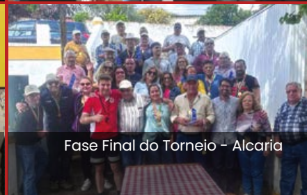
Fase Final do Torneio – Alcaria