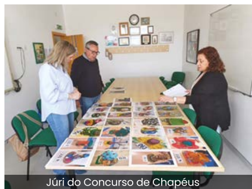
Júri do Concurso de Chapéus

O Agrupamento de Escolas de Vidigueira lançou o desafio “Chapéus de Primavera” aos seus alunos dos 1º, 2º e 3º Ciclos do Ensino Básico. Um concurso cujo objetivo foi criar chapéus inspirados na primavera. O resultado, repleto de criatividade e imaginação, originou uma coleção de se “Ihe tirar o chapéu”!