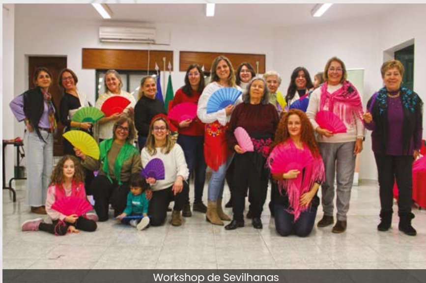
Workshop de Sevilhanas

A Junta de Freguesia deixou ainda nas redes sociais uma mensagem de reconhecimento às mulheres pelo papel que desempenham no dia-a-dia, seja na família, no trabalho ou na comunidade.