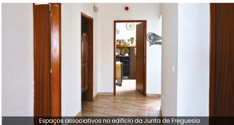
Espaços associativos no edifício da Junta de Freguesia