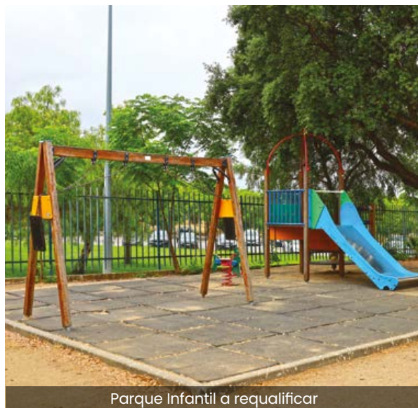
Parque Infantil a requalificar

A intervenção é promovida pela Junta de Freguesia e conta com o apoio financeiro do Município de Vidigueira, ao abrigo do Contrato Interadministrativo celebrado entre as duas autarquias.