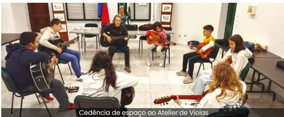
Cedência de espaço ao Atelier de Violas

Quinzenalmente, à segunda-feira, o espaço está também cedido ao Instituto de Emprego e Formação Profissional, I.P. de Beja, para desenvolvimento de atividades relacionadas com o Reconhecimento, Validação e Certificação de Competências Profissionais.