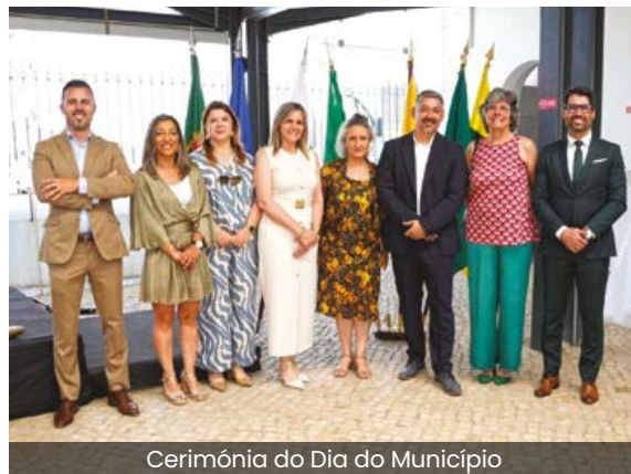
Cerimónia do Dia do Município