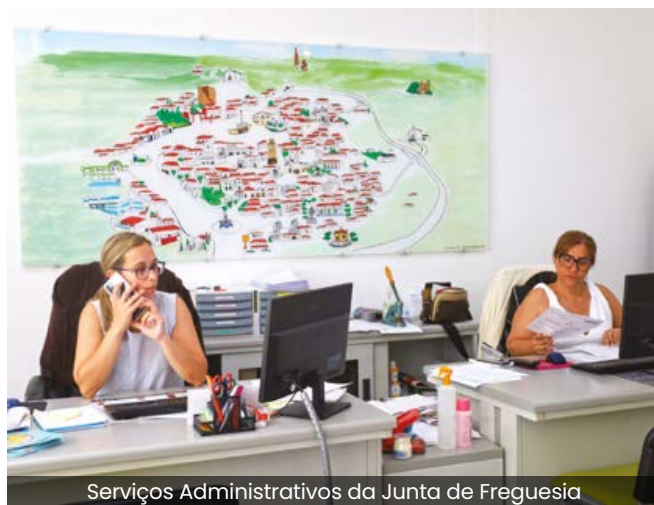
Serviços Administrativos da Junta de Freguesia

Todos os que precisem de ajuda podem recorrer ao apoio da Junta de Freguesia, durante o seu horário de expediente.