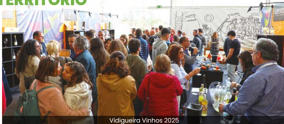
Vidigueira Vinhos 2025

A Junta de Freguesia de Vidigueira associou-se a mais uma edição da iniciativa “Vidigueira Vinho”, que decorreu de 18 a 20 abril 2025.