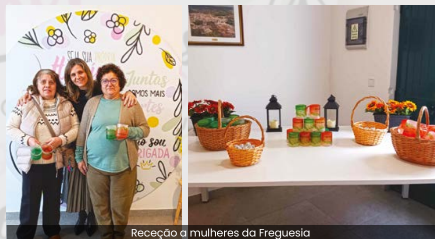
Receção a mulheres da Freguesia