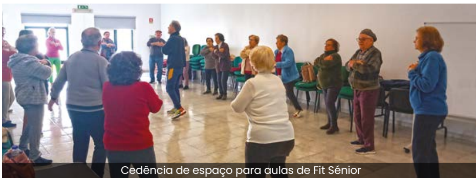
Cedência de espaço para aulas de Fit Sénior