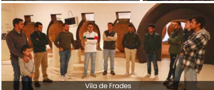
Vila de Frades