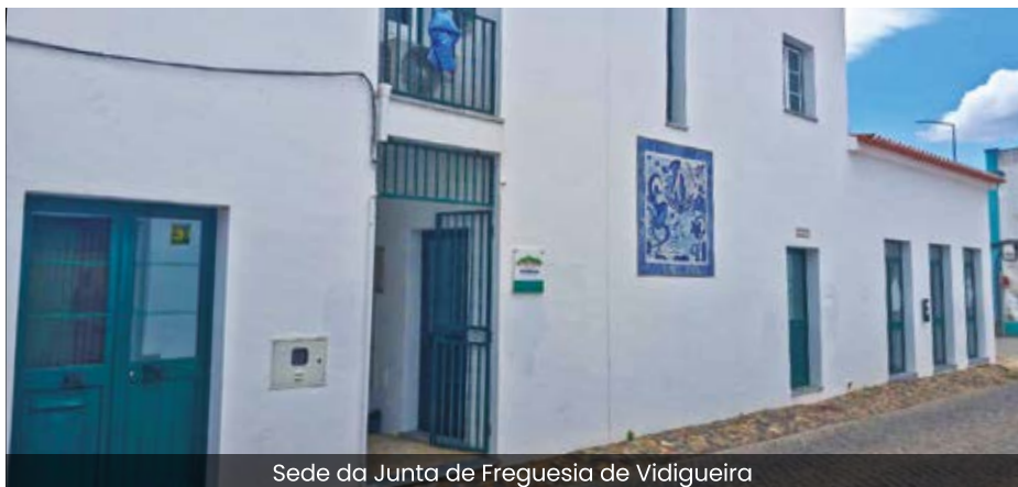
Sede da Junta de Freguesia de Vidigueira

Prevê-se que as despesas a realizar sejam também de 161 900 €, respeitando assim o princípio do equilíbrio financeiro, representando a Aquisição de Serviços (77 788 €) e as Despesas com Pessoal (34 762 €) 69,5 % das despesas correntes. Duas rubricas que garantem o funcionamento da Junta de Freguesia e a resposta do seu serviço a necessidades