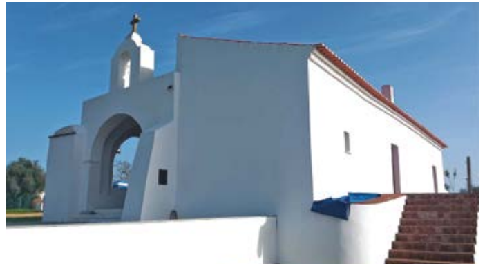
Conservação da Ermida de São Pedro

No início de fevereiro, a Junta de Freguesia tem contratado o serviço para manutenção e limpeza do espaço Miramendro.