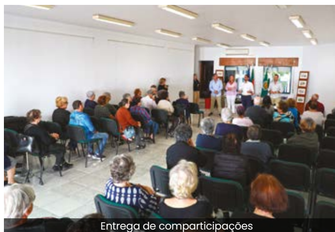
Entrega de comparticipações