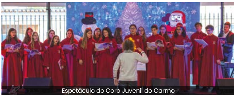
Espetáculo do Coro Juvenil do Carmo