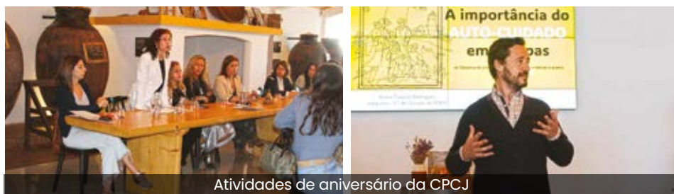
Atividades de aniversário da CPCJ