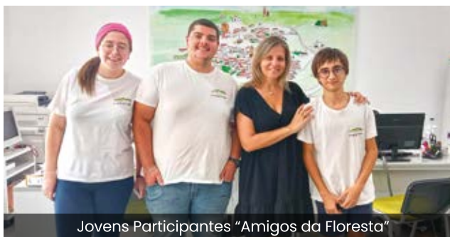
Jovens Participantes “Amigos da Floresta”

No passado mês de agosto, a Junta de Freguesia acolheu três jovens no âmbito do Programa “Amigos da Floresta 2024”, fruto da candidatura apresentada pelo Município de Vidigueira ao Instituto Português do Desporto e Juventude, entidade que promove este programa a nível nacional.