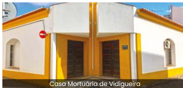
Casa Mortuária de Vidigueira

Após uma reavaliação do projeto e a decisão de efetuar uma intervenção mais abrangente do que a prevista inicialmente, para responder a um conjunto de necessidades diagnosticadas, ficou acordado que a responsabilidade da intervenção será partilhada entre a Câma-