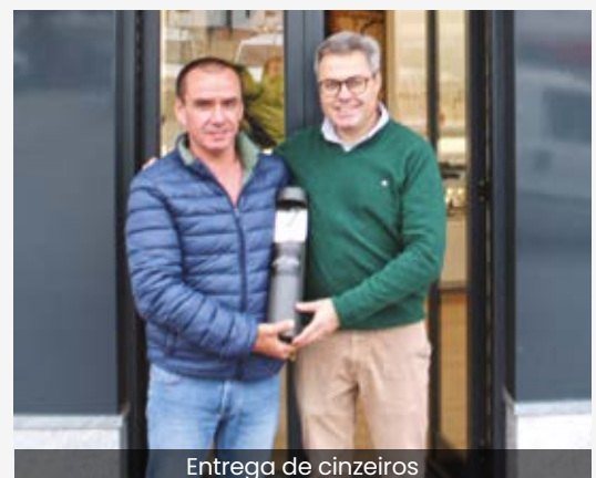
Entrega de cinzeiros

Desde 2020 que deitar beatas para o chão ou depositá-las em lugar inadequado é uma ação punida por lei, pelo que, nesta questão, é precisa a colaboração de todos os fumadores para melhorar a salubridade do espaço público e proteger o ambiente.