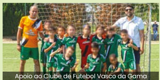
Apoio ao Clube de Futebol Vasco da Gama

Nos últimos meses, para além da presença em muitas atividades organizadas pelas associações e coletividades da Freguesia, há a destacar a atribuição de apoio ao Clube de Futebol Vasco da Gama, para a aquisição de equipamentos desportivos do escalão de Traquinas, o apoio ao Clube de Artes Marciais – Marcial Way, para a organização do Seminário Internacional de Krav Maga, o apoio à Associação Gama, para organização do evento “PEDDY DAS TASCAS” e o apoio ao Grupo Motard da Vidigueira, para a organização da XXVI Concentração Motard.