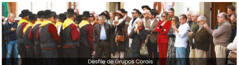
Desfile de Grupos Corais