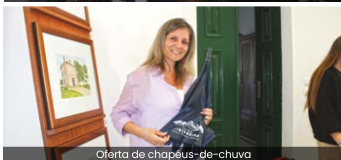
Oferta de chapéus-de-chuva