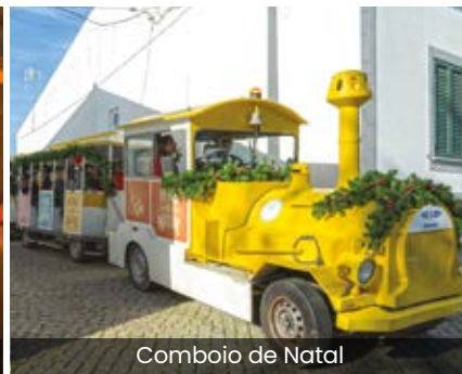
Comboio de Natal