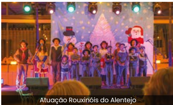
Atuação Rouxinóis do Alentejo