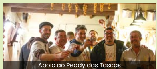
Apoio ao Peddy das Tascas