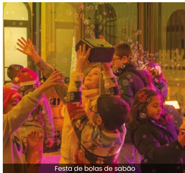
Festa de bolas de sabão

Em toda esta parceria há a destacar a disponibilidade da Câmara Municipal de Vidigueira, cujo apoio logístico é fundamental para a realização da iniciativa.