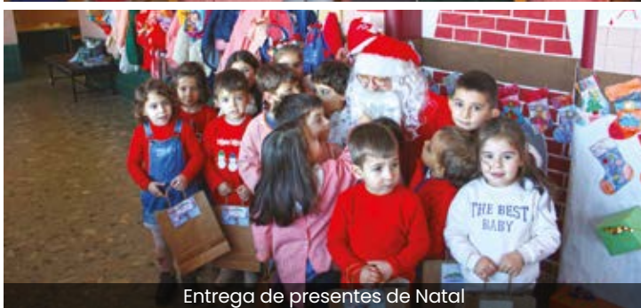
Entrega de presentes de Natal