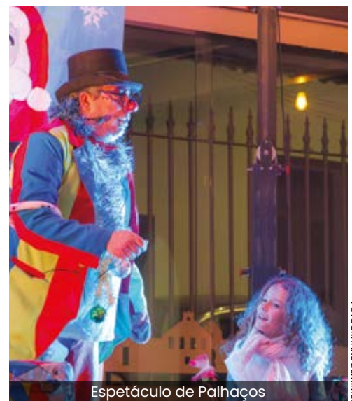
Espectáculo de Palhaços

momentos que a programação proporcionou ou usufruiu de um conjunto de atividades permanentes que animaram o evento durante os dois dias, com destaque para o espaço criança, os insufláveis, trampolins, trotinetes, rena mecânica, etc. Um conjunto de equipamentos que proporcionaram brincadeiras felizes aos mais pequenos. Houve ainda um Comboio de Natal que levou as famílias a passear pela Vila e uma Feira de Natal, com realce para a presença do artesanato e produtos locais, que contou também com a participação de associações e coletividades, e possibilitou que se adquirissem presentes de Natal.