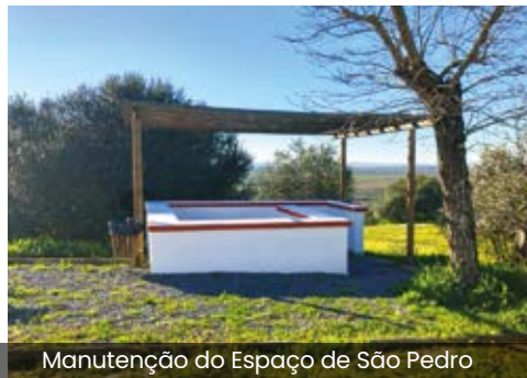
Manutenção do Espaço de São Pedro