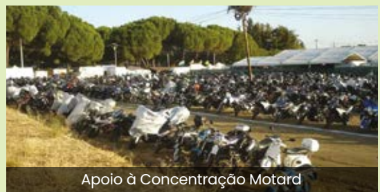
Apoio à Concentração Motard