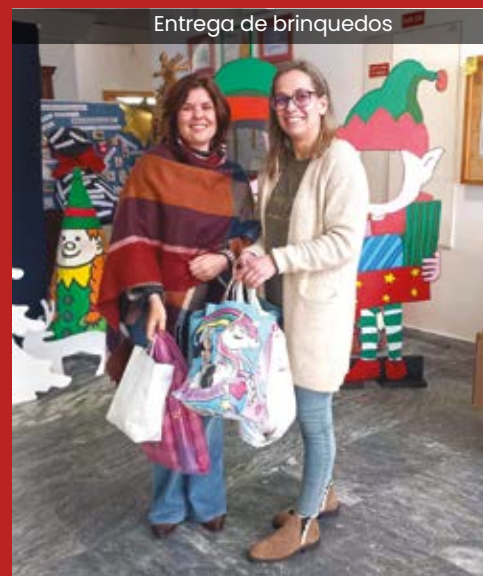
Entrega de brinquedos

Os brinquedos angariados na iniciativa foram entregues ao Agrupamento de Escolas de Vidigueira, no dia 6 de janeiro.