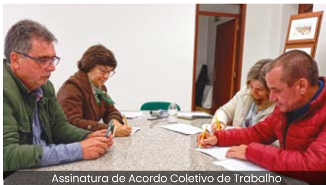
Assinatura de Acordo Coletivo de Trabalho

Este acordo vai permitir aos trabalhadores da Junta de Freguesia recuperar alguns direitos que lhe foram retirados, como é o caso da reposição de 3 dias de férias, constituindo uma elementar justiça para com os