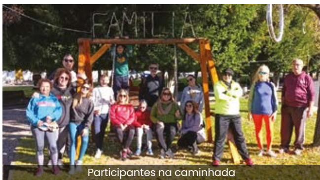
Participantes na caminhada