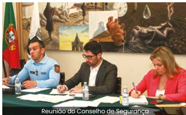
Reunião do Conselho de Segurança

Nas reuniões alargadas, há um período aberto à participação do público, onde os cidadãos podem expor questões relacionadas com as competências do órgão.