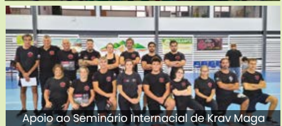
Apoio ao Seminário Internacial de Krav Maga