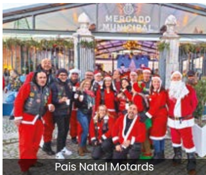
Pais Natal Motards