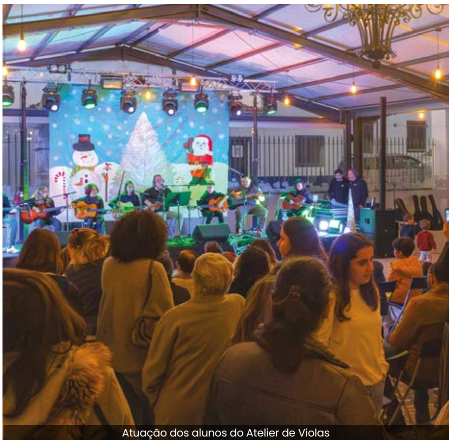
Atuação dos alunos do Atelier de Violas

Uma iniciativa que contribuiu para a animação natalícia da Freguesia e que se espera que tenha criado boas memórias no público infantil.