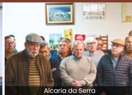
Alcaria da Serra