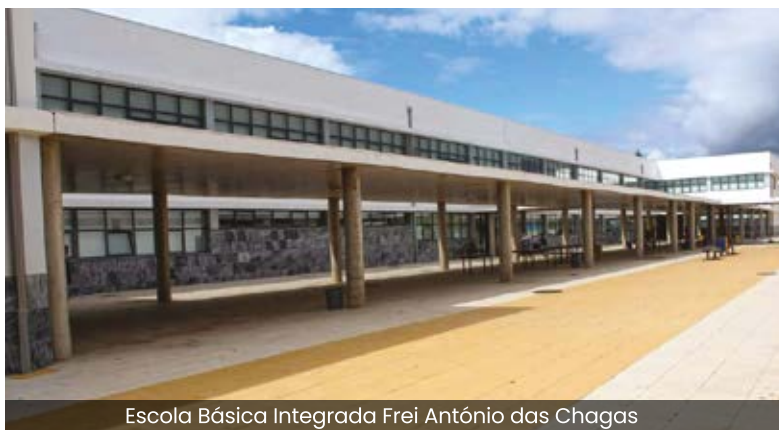
Escola Básica Integrada Frei António das Chagas

A educação desempenha um papel primordial no desenvolvimento da sociedade e dos seus cidadãos, sendo a escola pública fundamental para o acesso à educação. Um direito que é assegurado através da partilha de competências entre a Administração Central (Ministério da Educação), Câmaras Municipais e Juntas de Freguesia.