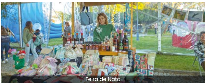
Feira de Natal